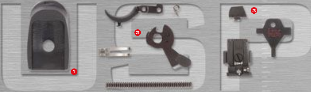
USP TUNING ZUBEHÖR BESTEHEND AUS: