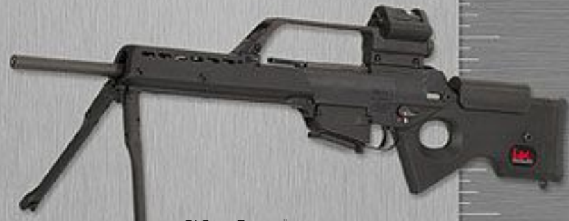
SL8 MIT TRAGEBÜGEL, DREIFACHOPTIK, REFLEXVISIER UND ZWEIFEIN