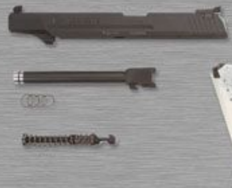
USP ELITE WECHSELSYSTEM von USP ELITE .45 Auto > USP ELITE 9mm x 19 von USP ELITE .45 Auto > USP EXPERT 9mm x 19