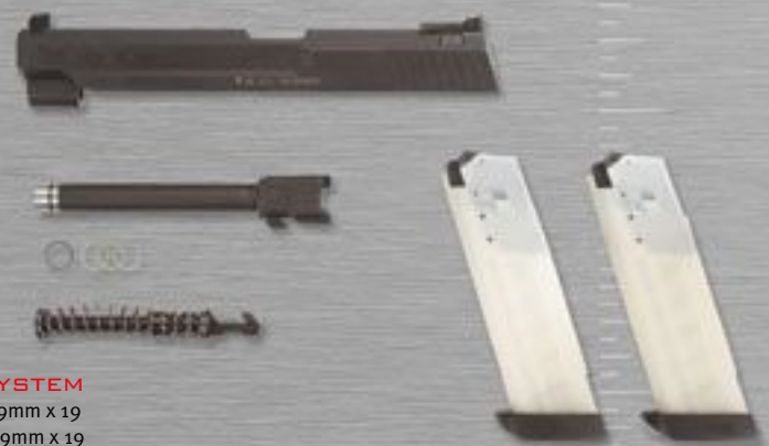
USP EXPERT WECHSELSYSTEM von USP EXPERT .45 Auto > USP EXPERT 9mm x 19 von USP EXPERT .40 S&W > USP EXPERT 9mm x 19