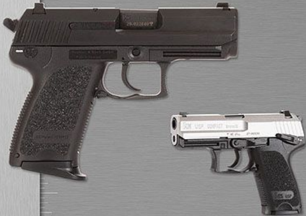
9MM X 19