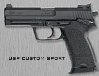
USP CUSTOM SPORT