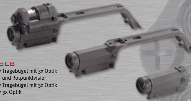
SL8 • Tragebügel mit 3x Optik und Rotpunktvisier • Tragebügel mit 3x Optik • 3x Optik