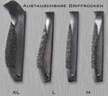
AUSTAUSCHBARE GRIFFRÜCKEN XL L M S