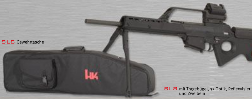
SL8 Gewehrtasche SL8 mit Tragebügel, 3x Optik, Reflexvisier und Zweibein