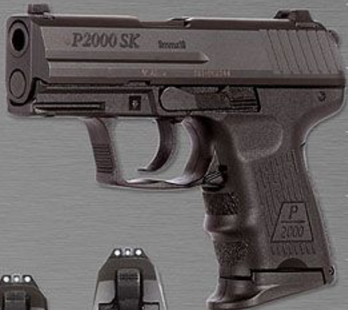
P2000 SK MIT VERLÄNGERTEM MAGAZINSCHUH

Ihre geringeren Außenmaße und das niedrige Gewicht, machen Sie zur optimalen Pistole für den Jäger.