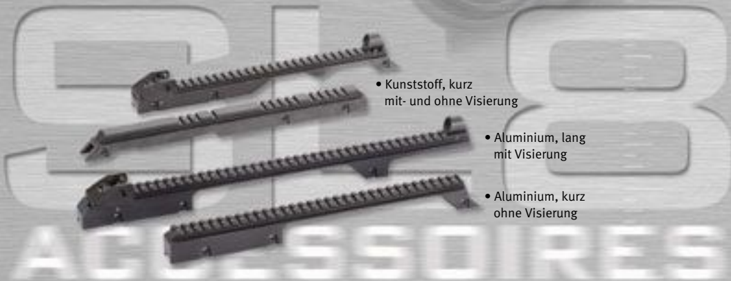
• Kunststoff, kurz mit- und ohne Visierung • Aluminium, lang mit Visierung • Aluminium, kurz ohne Visierung SL8 Kurze und lange Montageschienen für optische oder mechanische Visierungen, in Aluminium- oder Kunststoffausführung